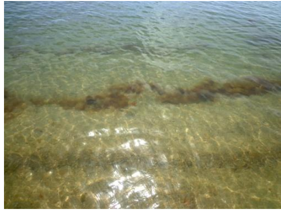
สภาพชายฝั่งบริเวณหาดชลาทัศน์ที่สำรวจ