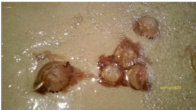
แมงกะพรุนไฟ Chrysaora chinensis