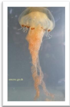
แมงกะพรุนไฟ