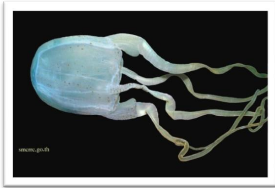
แมงกะพรุนกล่องหนวดเส้นเดียว