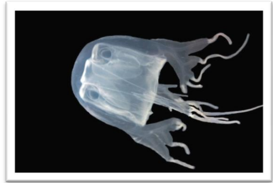
แมงกะพรุนกล่องหนวดหลายเส้น