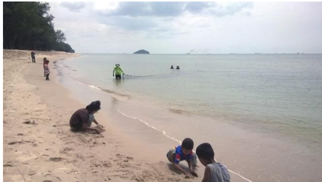
ใช้อวนทับตลิ่งเล็กในการสำรวจแมงกะพรุนไฟ