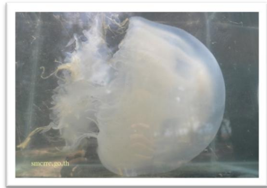
แมงกะพรุนหนัง