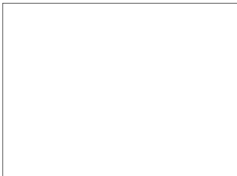
ภาพด้านหน้า