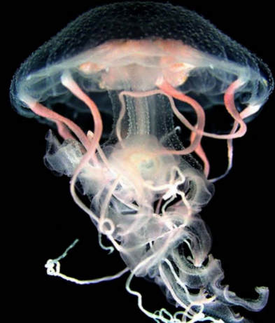
แมงกะพรุนไฟ Pelagia panopyra