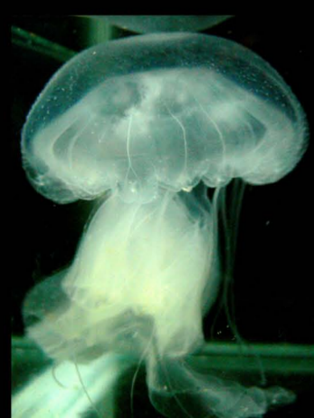
แมงกะพรุนไฟ Chrysaora sp.