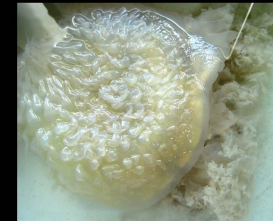
แมงกะพรุนลอดช่อง Lobonema smithii