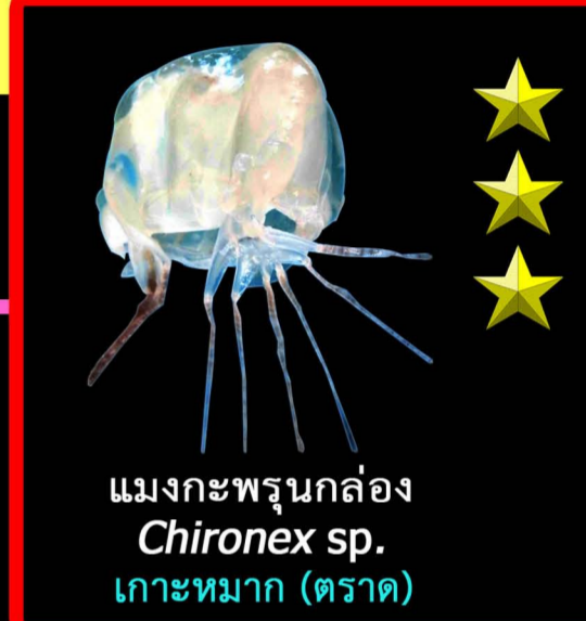
แมงกะพรุนกล่อง Chironex sp. เกาะหมาก (ตราด)