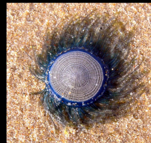
แมงกะพรุนเหรียญ, แว่นตาพระอินทร์ Porpita porpita