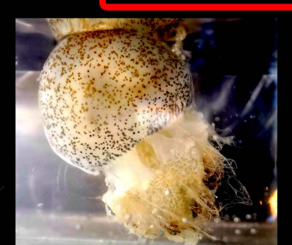
แมงกะพรุนขี้ไก่ Catostylus townsendi