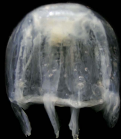
แมงกะพรุนกล่อง, จอกแก้ว Mobakka sp.

เกาะห้า (สุราษฎร์ฯ), รายงาน ชนอม, แหลมตะลุมพุก (นครศรีฯ), การพบเห็น อ่าวน้ำบ่อ (ภูเก็ต), เกาะลันตา, เกาะพีพี (กระบี่) และ บ้านบุโบย (สตูล)