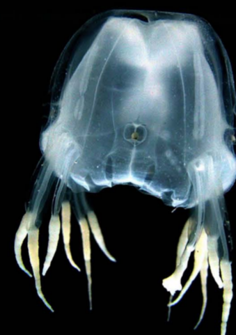
แมงกะพรุนกล่อง Tripedalia cystophora อ่าวน้ำบ่อ (ภูเก็ต)

เกาะห้า (สุราษฎร์ฯ), ชนอม, แหลมตะลุมพุก (นครศรีฯ), เกาะลันตา (กระบี่) และ เกาะเขาใหญ่ (สตูล) (ภาพถ่ายอย่างไม่สมบูรณ์ เนื่องจากทวนดบังสี่เส้นขาด)