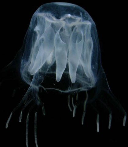
แมงกะพรุนกล่อง, ลูกจอก, บอบบจอก Chiropsoides buitendijki

เกาะห้า (สุราษฎร์ฯ), รายงาน ชนอม, แหลมตะลุมพุก (นครศรีฯ), การพบเห็น อ่าวน้ำบ่อ (ภูเก็ต), เกาะลันตา, เกาะพีพี (กระบี่) และ บ้านบุโบย (สตูล)