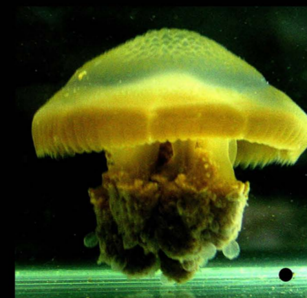
แมงกะพรุนหอม Mastigias sp.