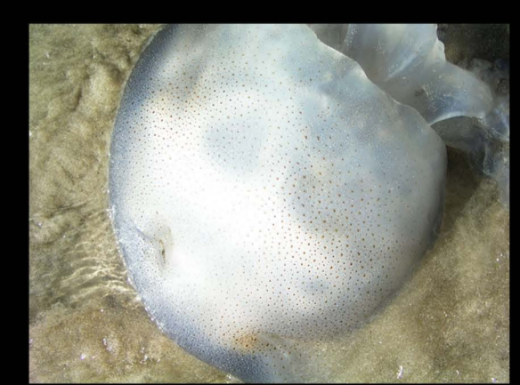
แมงกะพรุนหน้าง Rhopilema hispidum