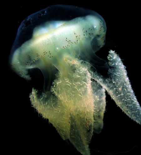
แมงกะพรุนหางขน Acromitus flagellatus